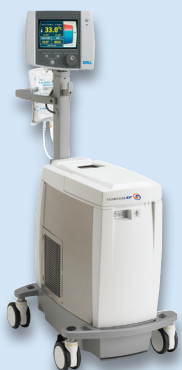
Système Thermogard XP® (TGXP) de gestion intravasculaire de la température (IVTM™)

Veuillez consulter les documents de référence concernant les indications d'utilisation du cathéter ou visiter le site www.zoll.com .